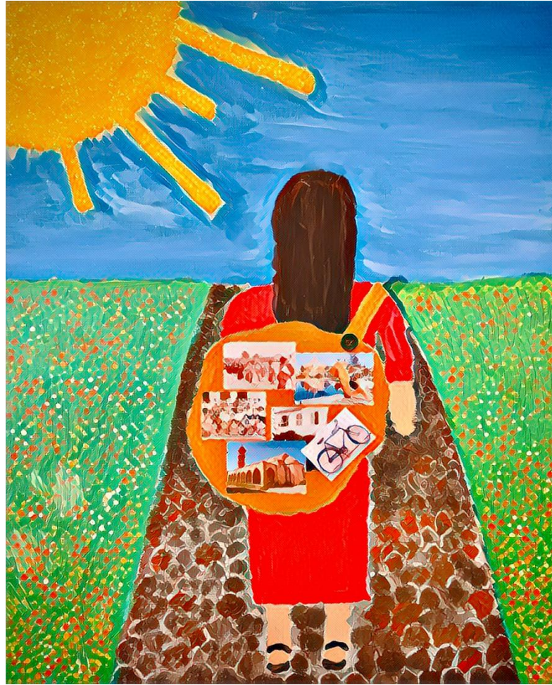
A3: Με το βλέμμα στραμμένο στο φως