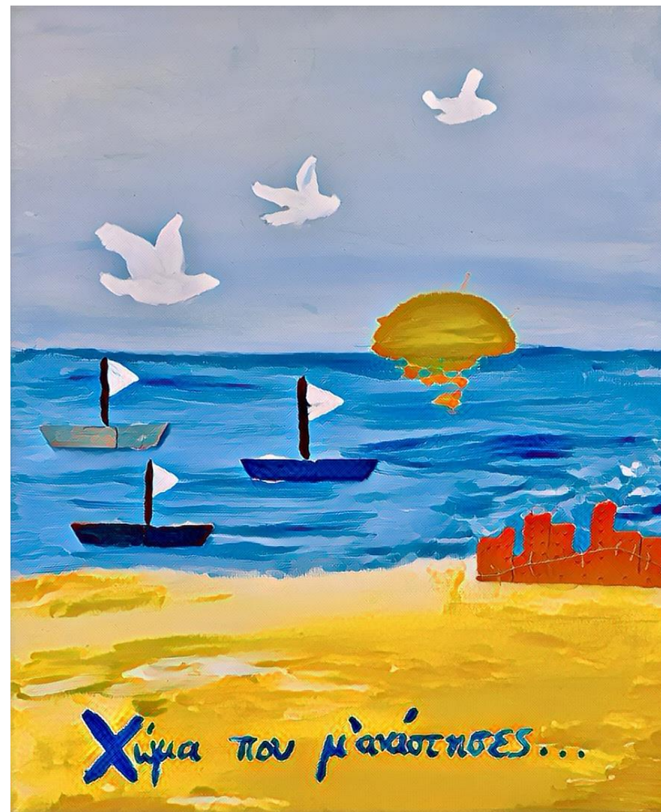
Δ2: Χώρα που μ'ανάστησες