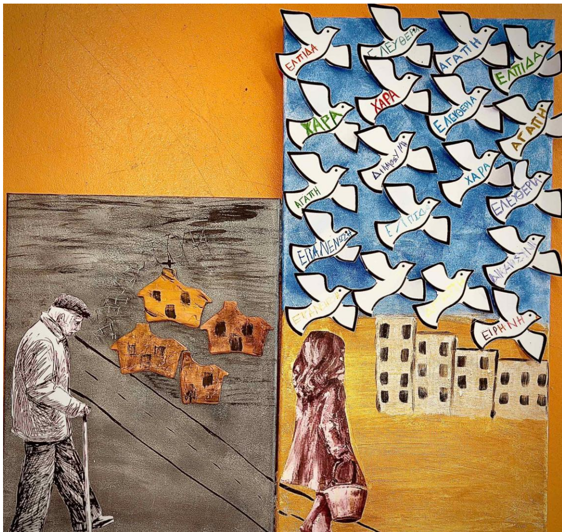
B3: Με το βλέμμα στο μέλλον - Ελπίδα