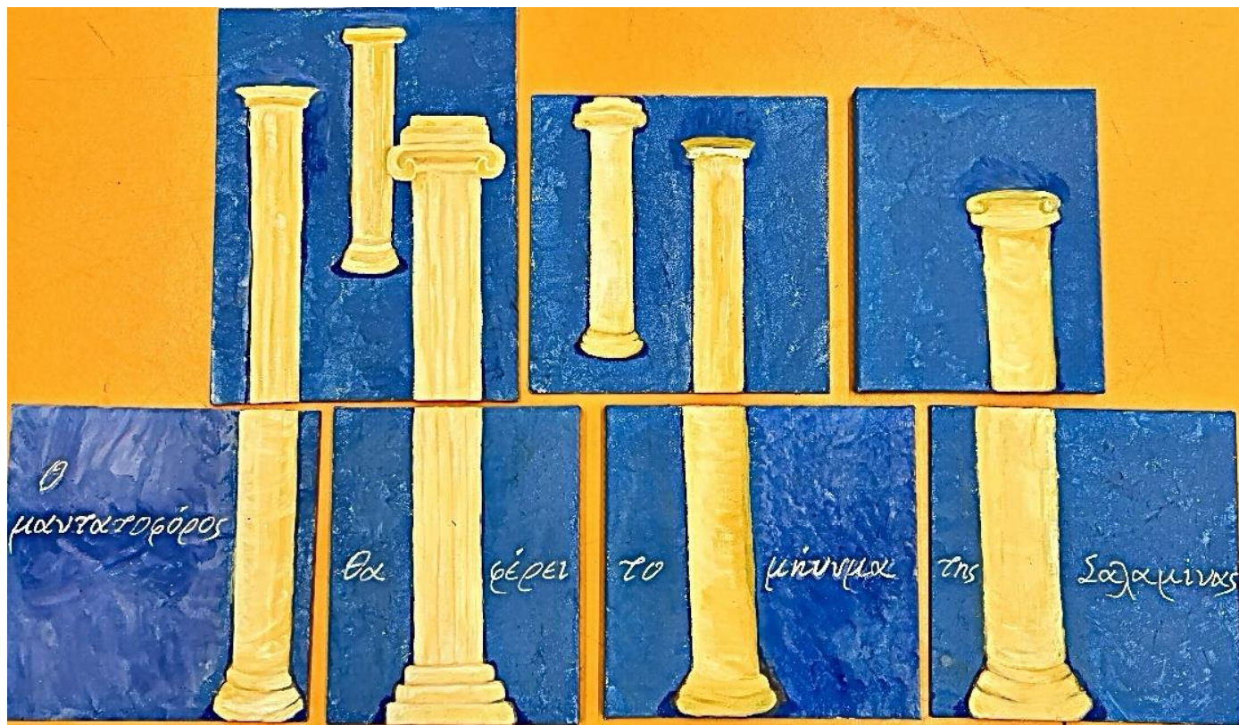
Γ1: Το μήνυμα της Σαλαμίνας