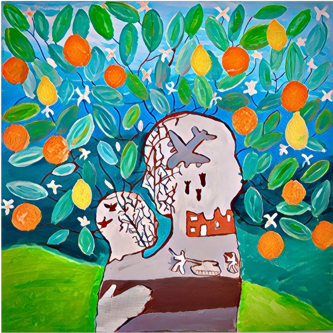
Ε2: Ας μη ριζώσει το κακό