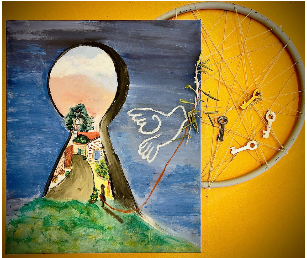
Ε3: Ξεκλειδώνοντας μνήμες