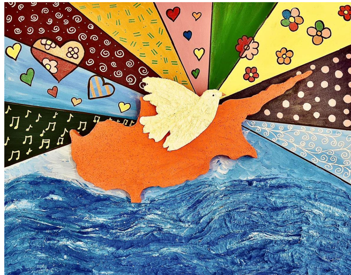
A1-A2: Θαλασσοφίλητή μου γη