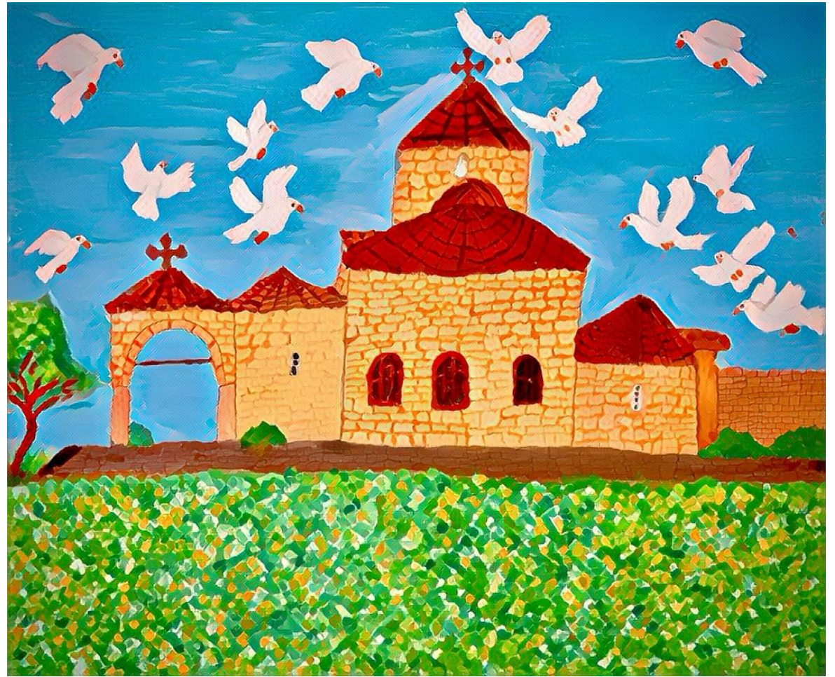
Στ1: Παναγία Κανακαριά