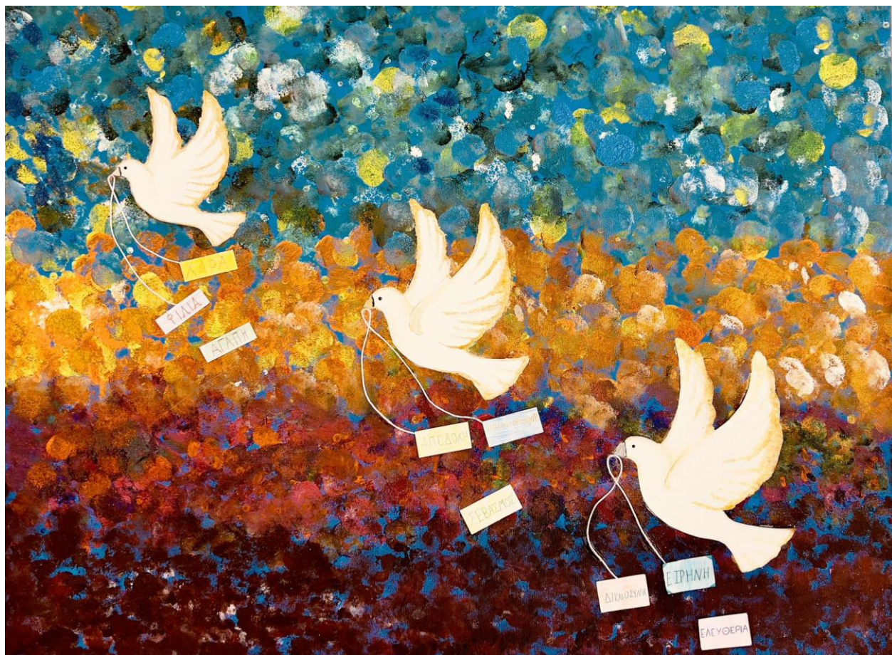
Δ1: Παγκόσμια ειρήνη